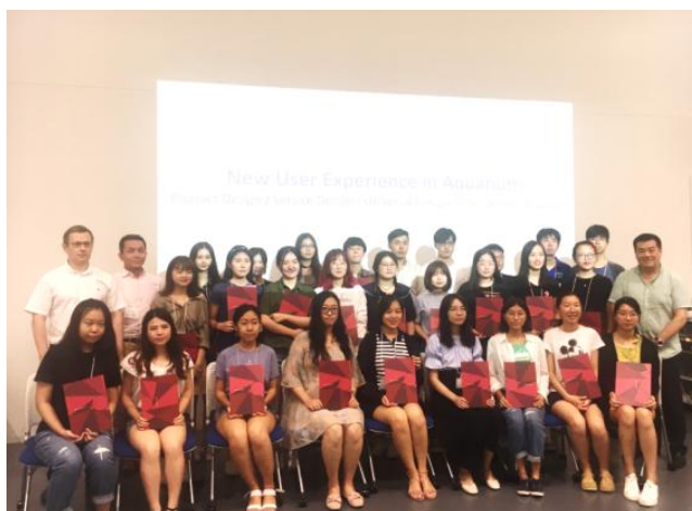
(往届线下课程结业证书颁发现场)